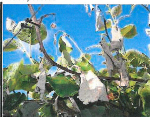
Dessèchement des pousses