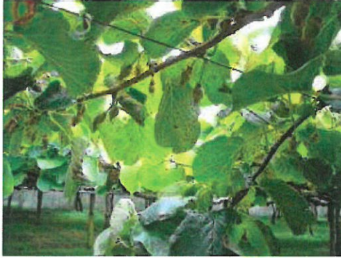
Couvert présentant des feuilles tachées