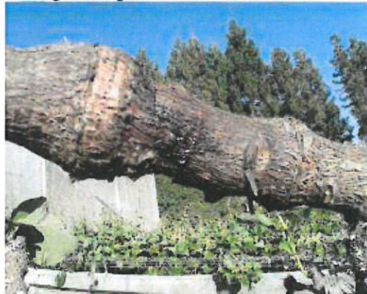
Chancre sur le plant de kiwis