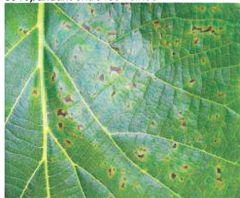
Taches cerclées d'un halo