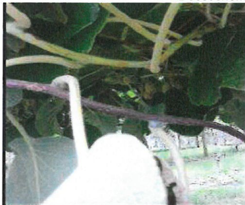
Décoloration bleu-noire des pousses – le stade précoce du dessèchement