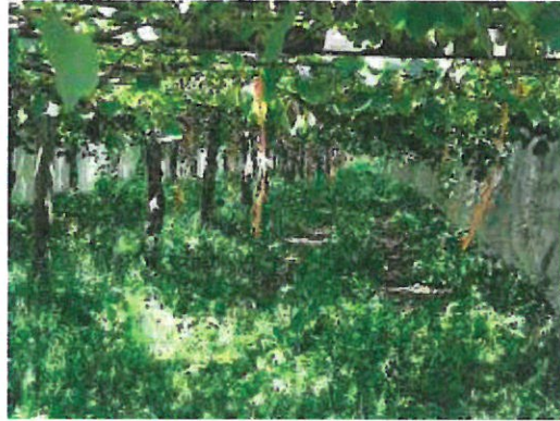
Couvert présentant des taches foliaires marquées avec un ruban de couleur.