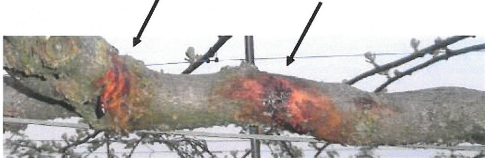
Suintement sec rouge / orangé