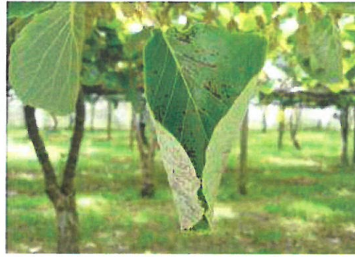
Feuilles tachées commençant à se creuser