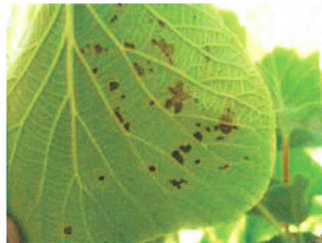
Taches foncées irrégulières se répandant entre les veines