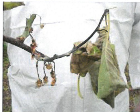
Dessèchement des pousses