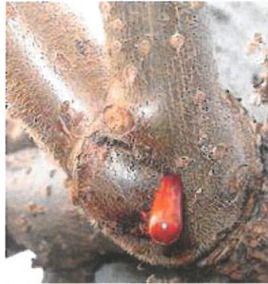
Suintement frais rouge orangé